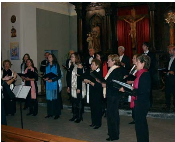
IX Encuentro de Corales.

Concierto con las corales Barbitania (Barbastro), Hermandad de empleados CAI (Zaragoza) y Villa de Graus .