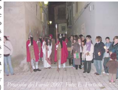
Procesión del Farolé 2007.

Este año la Semana Santa cai luego, asinas mos habrem de abrigá más el domingo Ramos (16), que é cuan s'estrena la ropa de "nueva temporada". Ixe día se bendecirán ramas d'olivera. El miércoles santo (19) se farà la procesión del farolé , que tamé le dicen de las beatas , porque antes eba sólo pa las mullés. Ahora ixo ha cambiau, tamé ie van hombres, lo mismo que desde fa tiempo tamé van mullés a la del viernes santo. El jueves santo (20) se celebrará la Cena del Siño y la Hora Santa; y el viernes (21) per la tarde, la Pasión de Cristo y la procesión del Santo Entierro, en la que sallen toz los pasos y el sepulcro custodiau per los judíos. El sábado santo (22), se bendice l'agua que s'emplleará el resto del año en los oficios. Tamé la chen se'n lleva ta casa pa tení-la bendecida. Ixe día se fa la Vigilia Pascual.